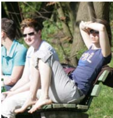
Bei dieser Mannschaft können die Fans ganz entspannt sein.

Unser vorübergehendes Formtief haben wir hoffentlich überwunden. Nach einem schlechten Spiel gegen Du-Süd hieß es „Hauptsache gewonnen“. Zum Glück geht nach einem noch schlechteren Spiel gegen DJK Wanheimerort , das wir mit 4:0 verloren haben, die Kurve langsam wieder nach oben. Gute Kombinationen zeigten wir schon wieder beim Vfl Wedau und bewiesen in Broeckhuysen beim 2:1 Sieg, dass wir eine Mannschaft mit Team- und Kampfgeist sind. Beim Sieg gegen Germania Wemb zeigten wir dann, dass wir auch echt guten Fußball spielen können. Mit zehn Punkten Vorsprung auf den Tabellendritten und noch vier Spieltagen könnten wir schon im nächsten Spiel die Vizemeisterschaft klar machen. Damit hätten wir unser Saisonziel, unter den ersten fünf zu landen, mehr als übertroffen. [njkt]