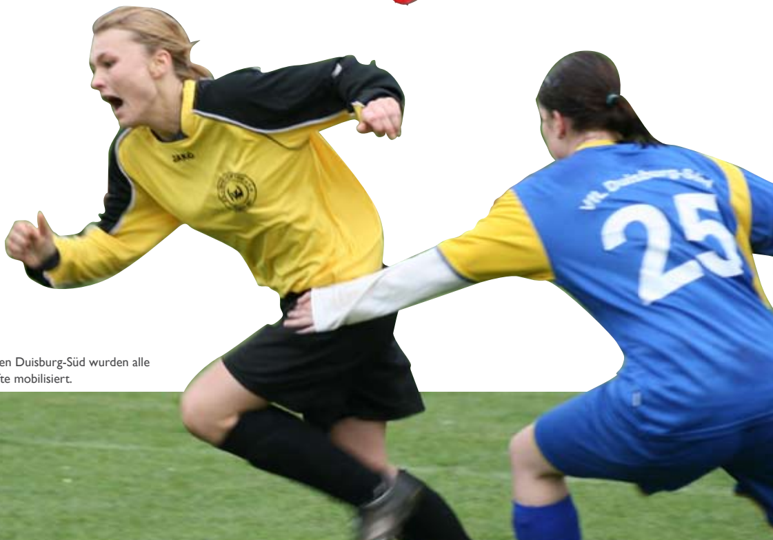
Gegen Duisburg-Süd wurden alle Kräfte mobilisiert.